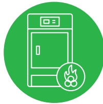
KOTEL NA BIOMASU